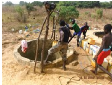
ses garçons tirent l'eau