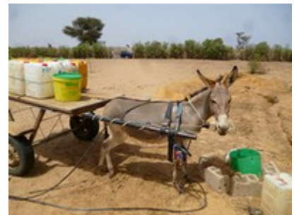
et l'âne prêt à partir

Son travail assure directement le quotidien d'une famille de 35 personnes (sa femme et enfants ainsi que trois frères dont un handicapé et leur famille); indirectement aussi des revendeurs dans le village (bidons d'eau, légumes, fruits). Actuellement, l'eau est remontée à la force des bras, filtrée et versée dans des bidons de 20 litres. Son maraîchage, sur un terrain de près d'un ha, (14°10'34"N - 16°39'32"O) se limite aujourd'hui à la culture du mil (céréale) et quelques fruitiers (bananiers, manguiers).