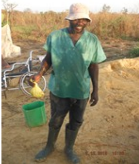
Arfang le maraîcher