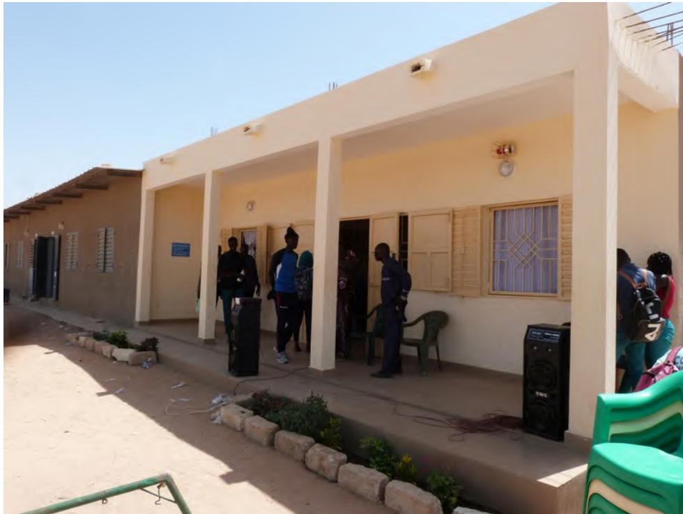
Nouveau bloc administratif du collège de Ngaparou

Après réception des devis, le conseil d'administration proposera à l'AG les priorités retenues.