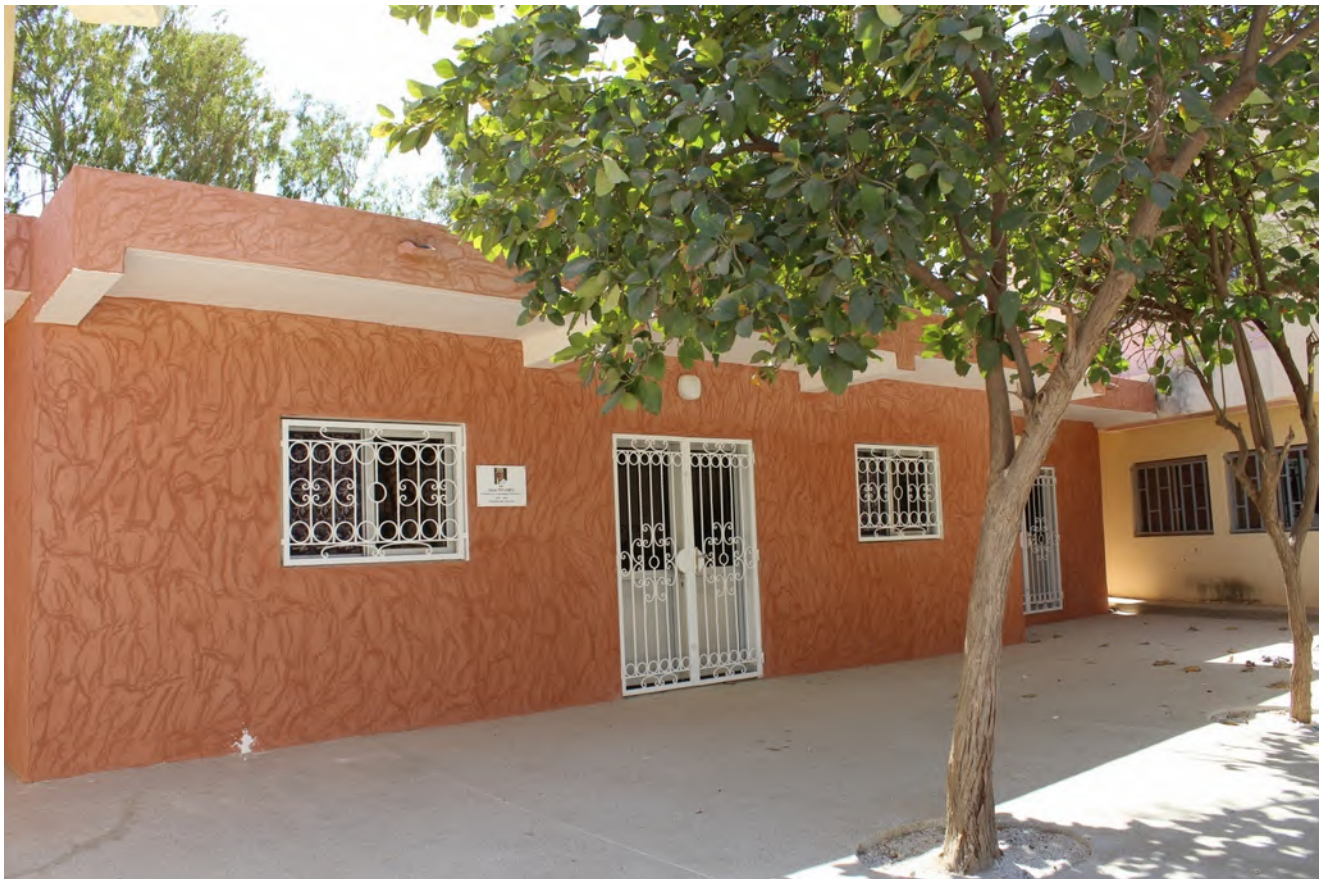
Maison de la Femme à Somone

(Réponse, c'est au Comité Consultatif des Femmes de gérer cette structure. Nous avons rappelé qu'effectivement c'était une exigence de Teranga que ce bâtiment soit exclusivement dévolu au CCF contre un financement de la rénovation. « La mairie a donné suite pour ne pas froisser un partenaire historique de Somone !... ». Nous avons rappelé au maire que la commune s'était engagée à recruter une monitrice pour assurer une formation aux femmes de Somone. Aucune réponse ne nous a été donnée.)