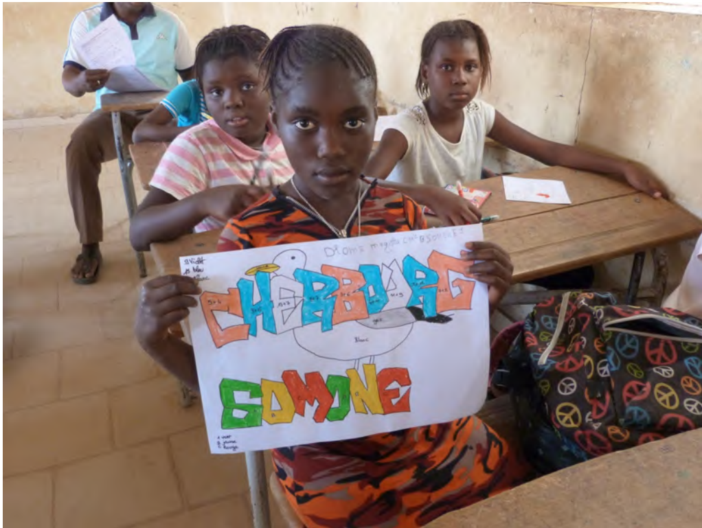
Coloriages magiques en CM1 à Somone 1